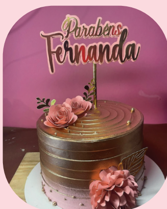
Rosê ao dourado