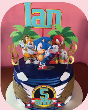
Topo de bolo