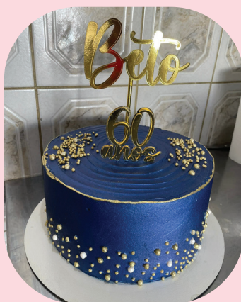
Pó de decoração cor forte