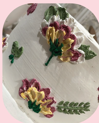
Flores desenhadas à mão